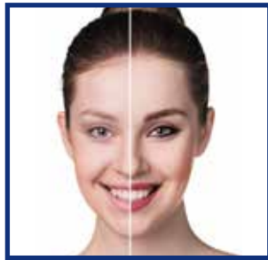
Vorher | Nacher

Ihre Natürlichkeit und Ausdrucksstärke wird durch die Reinigung und Pflege Ihres Gesichts verbessert. Mir ist es wichtig, Ihnen ein Wohlgefühl zu verleihen.